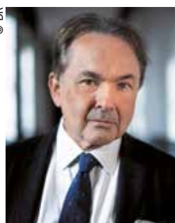
■ Gilles Kepel.