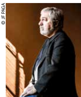
■ Sorj Chalandon.